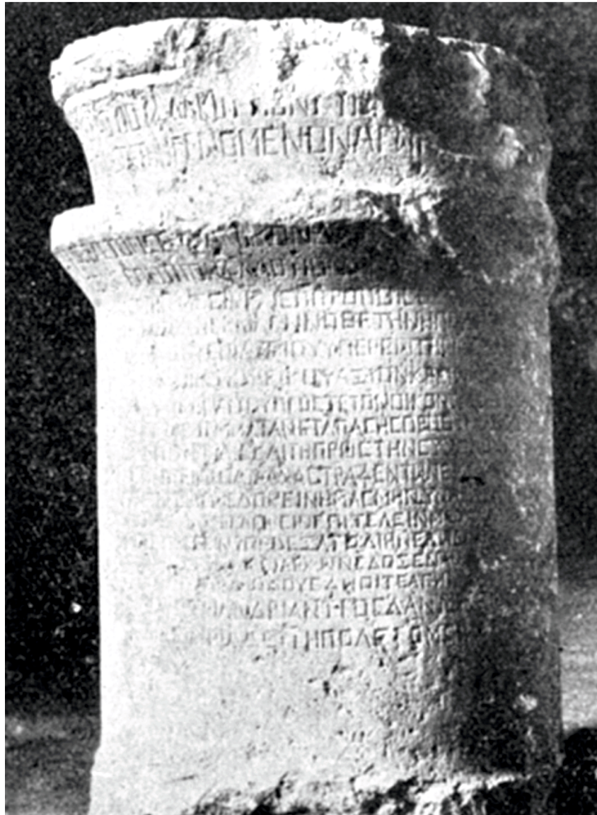
Рис. 3. Надпись из Джераша