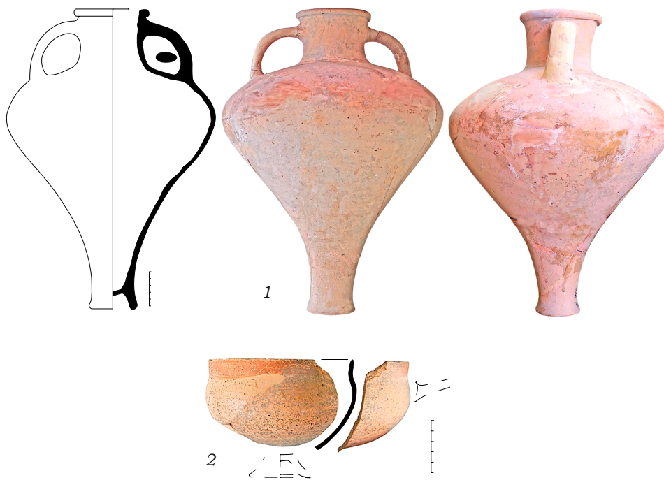
Рис. 1. Античная керамика из погребений синдского могильника ОПХ «Анапа»: 1 – амфора (погр. 7), 2 – фрагмент килика (погр. 20)