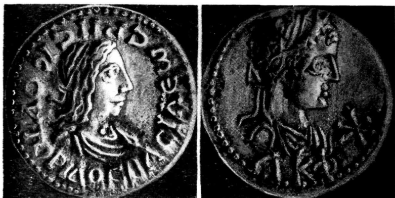
Рис. 3. Статер Рескупорида III (210—226 гг. н. э.) из патрийского клада 1968 года (увеличено в 2,5 раза).

за III в. н. э.). Кроме монет в клад входят 2 бронзовых кольца, 2 бронзовых пряжки, 1 браслет, 1 сильно разрушенная фибула и 1 пастовая бусина. Видимо, клад был заключен в деревянный ящик или шкатулку, от которой сохранилось лишь 2 небольших железных гвоздя. Датировка клада не нарушает принятой нами датировки слоя, а происхождение его, видимо, должно быть связано с общим упадком Боспорского государства, начиная с середины III в. н. э. 3