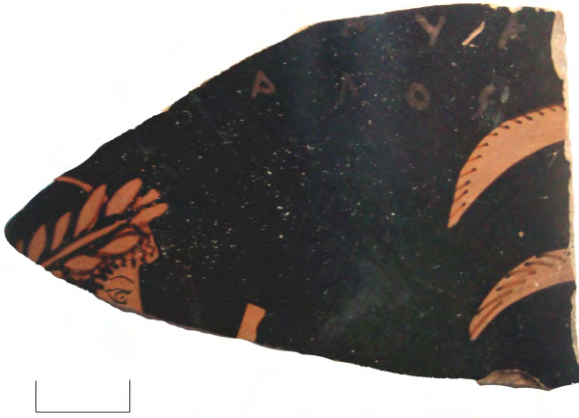
Рис. 1. Фото фрагмента с надписью