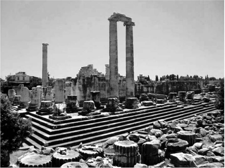
Фото 5. Храм Аполлона в Дидиме