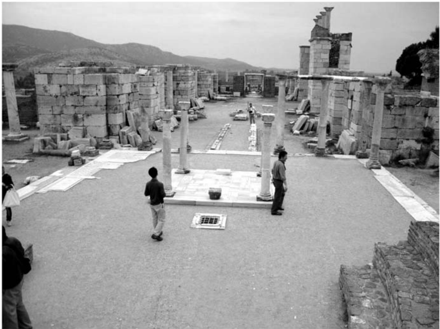
Фото 2. Современное состояние храма Иоанна Богослова в Эфесе