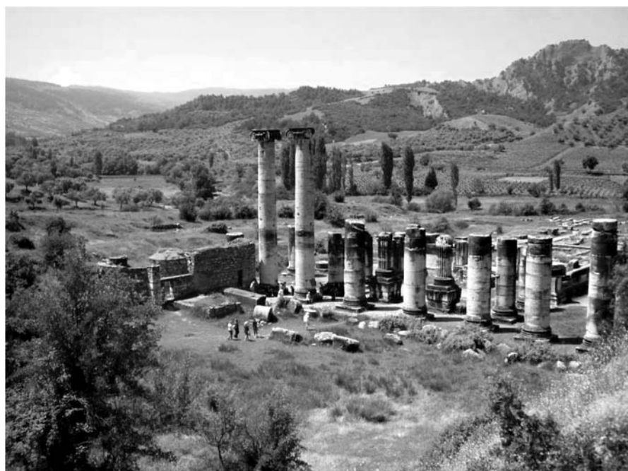
Фото 3. Храм Артемиды в Сардах