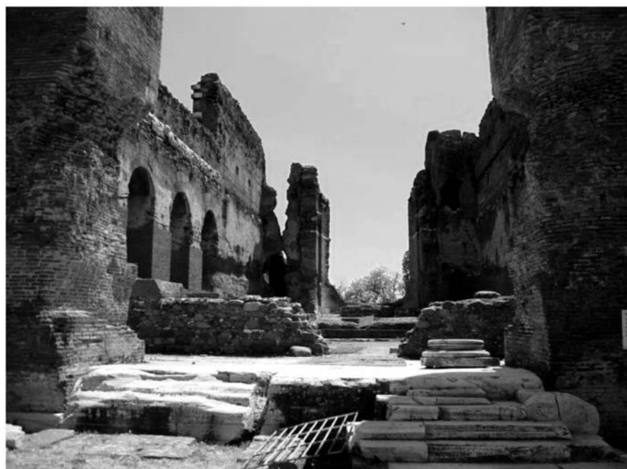
Фото 4. «Красный двор» в Пергаме