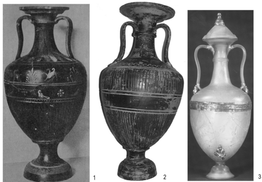
Рис. 2. Сосуды из собрания Эрмитажа (1) и Берлинских музеев (2, 3)