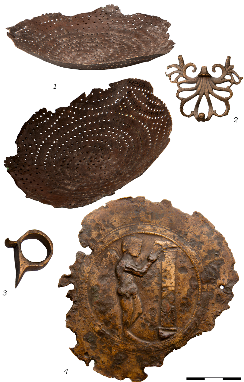
Рис. 3. Валовый-І. Курган № 9/1987. Погребение № 1. Бронзовые предметы. Азов, АИАПМЗ: 1 – нижняя часть вместилища цеделки, инв. № КП-25309/275; 2 – пластина в форме ажурной пальметты, инв. № КП-25309/257; 3 – ручка светильника (?), инв. № КП-25309/250; 4 – медальон патеры, инв. № КП-25309/278.