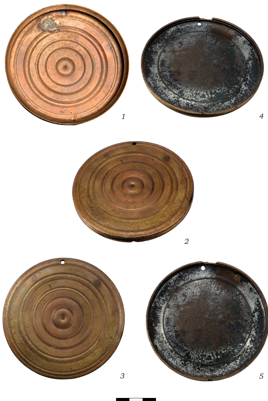
Рис. 4. Валовый-І. Курган № 9/1987. Погребение № 1. Бронзовые створки двухчастного зеркала. Азов, АИАПМЗ, инв. № КП-25309/276-277.