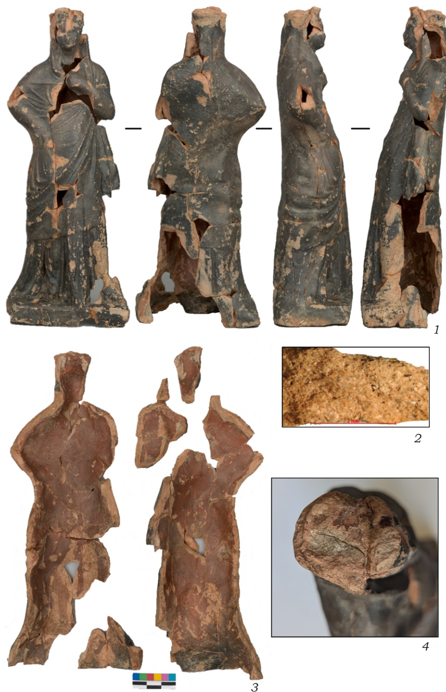
Рис. 3. Чернотаковая статуэтка, открытая западнее кладки № 560, Малая Азия. 1 – общий вид; 2 – микрофото скола (сделаны в лаборатории кафедры археологии исторического факультета МГУ имени М.В. Ломоносова на микроскопе Zeiss Stemi 2000); 3 – вид на внутреннюю поверхность; 4 – вид сверху на остатки лакового покрытия