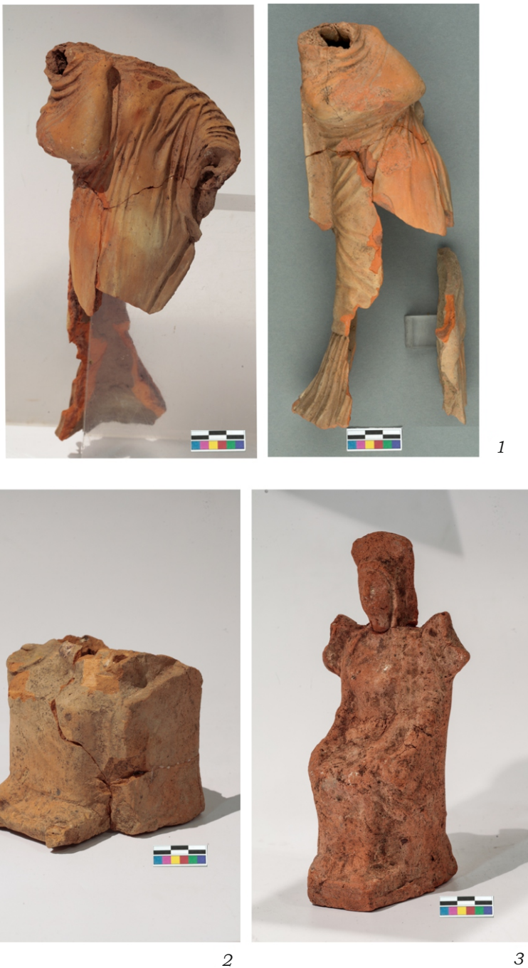
Рис. 2. Терракотовые статуэтки, открытые западнее кладки № 560. 1 – танцовщица, Мирины; 2 – нижняя часть фигуры богини на троне, Боспор; 3 – богиня на троне, Боспор