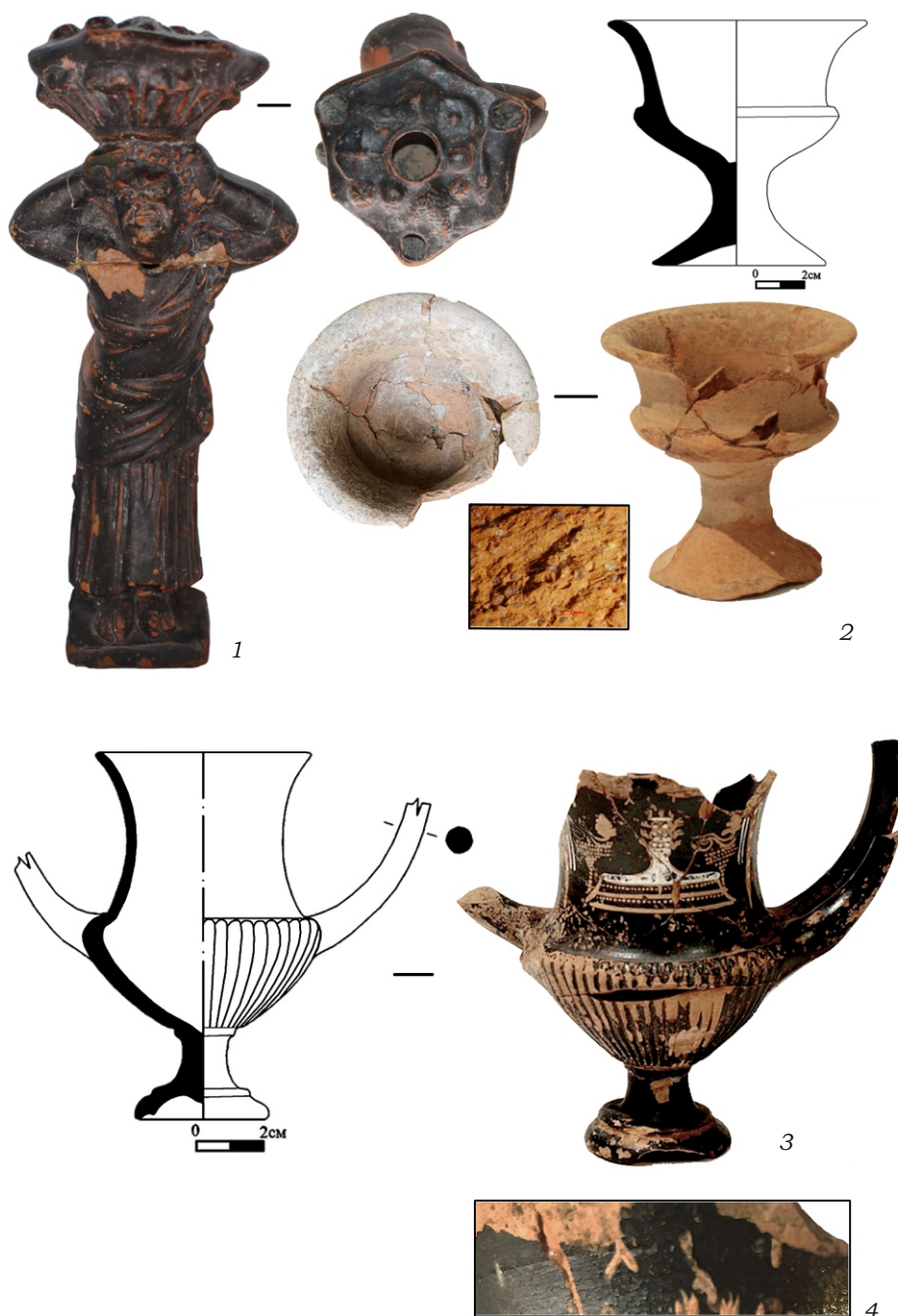
Рис. 4. 1 – чернолаковая статуэтка-святильник из Горгиппии; 2 – красноглиняный фимиатерий, Боспор; 3, 4 – чернолаковый кубковидный канфар, Аттика